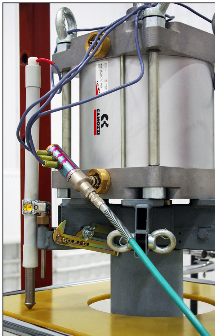
Рис.3. Крепление пневмомагистрали к пневмоцилиндру

разъёмных соединений присоединяют к нагрузочному пневмоцилиндру Рис.3.