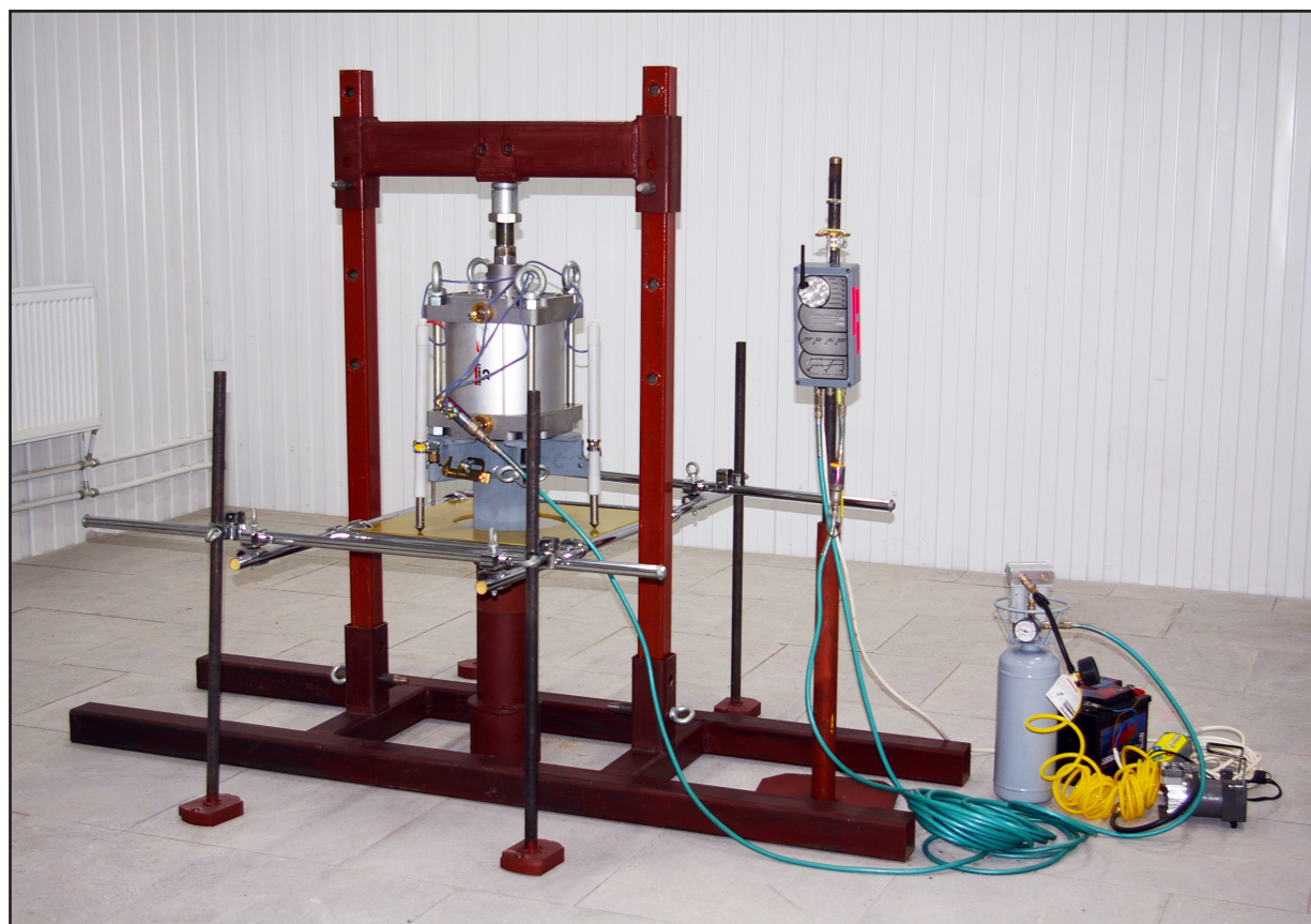
Рис.1. Общий вид комплекта