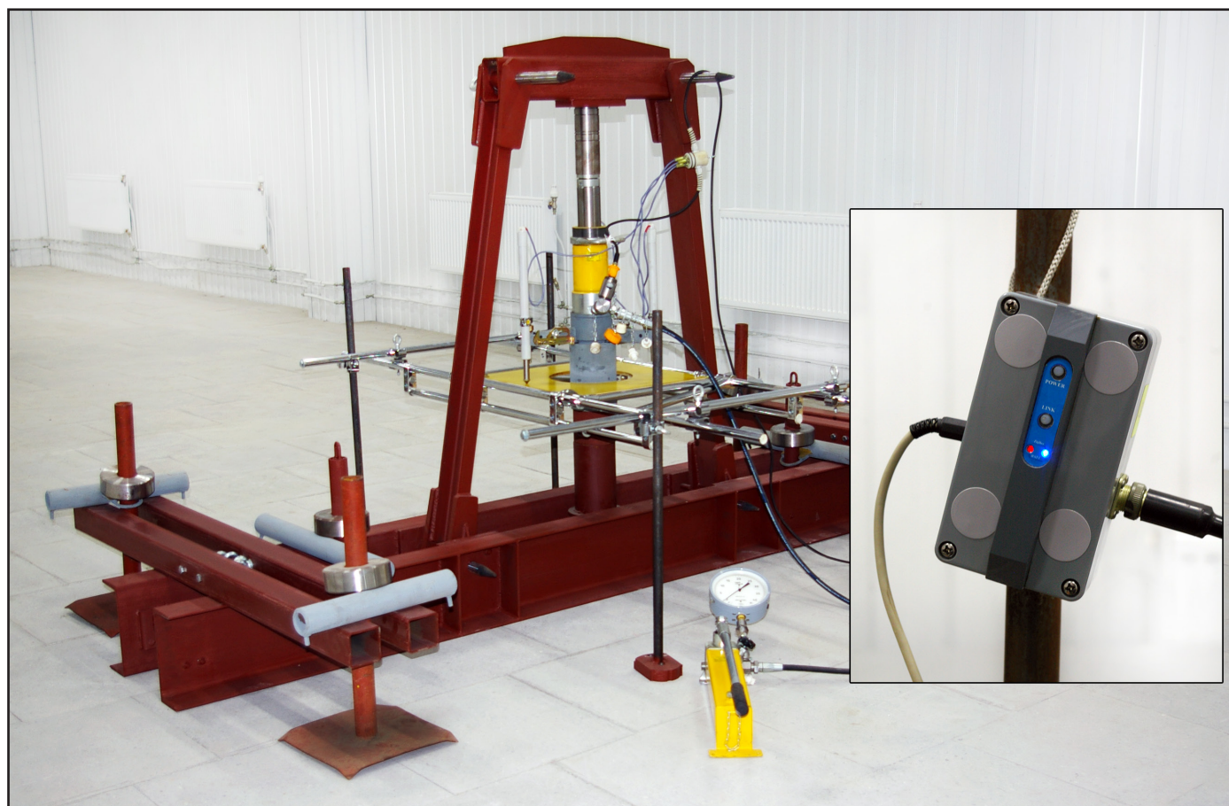
Рис.1. Общий вид комплекта